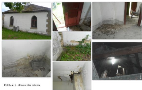
Příloha č. 5 - aktuální stav márnice